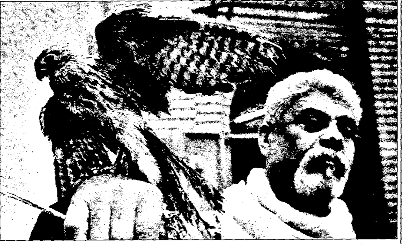
عراقي يعرض سمرالبيع في بغداد